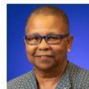
Hope Markes Round Hill Estate, Hanover, Jamaïque