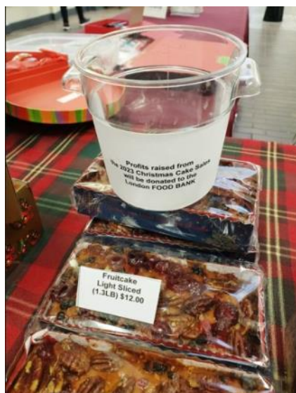
Don d'un conteneur au Centre commercial Cherry Hill