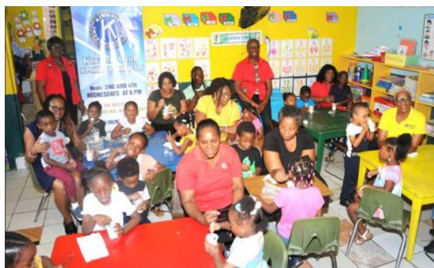
Des membres du club Kiwanis de Providence-Montego Bay, entièrement féminin, attirent les enfants avec des friandises sucrées